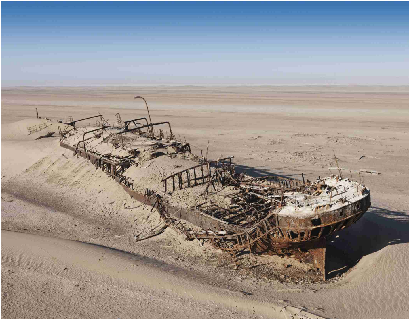
la Skeleton Coast