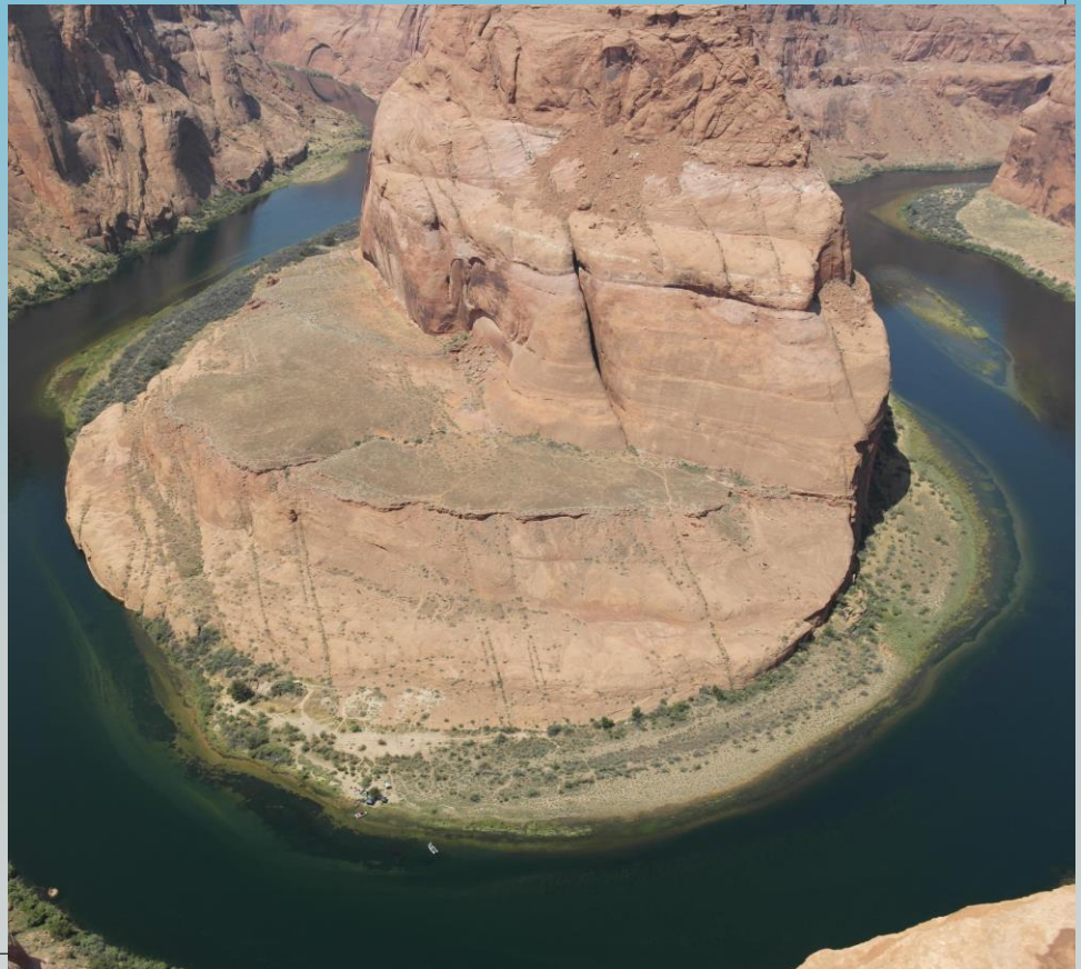
Dalla Monument Valley a Los Angeles passando per Page e il Grand Canyon