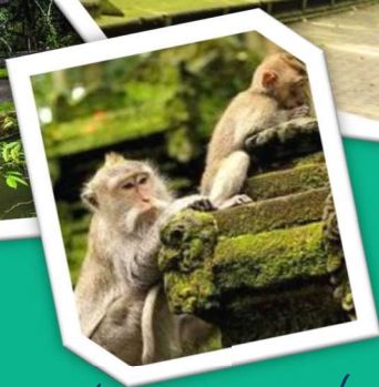
Mengwi tempio della famiglia reale, il famoso Taman Ayun