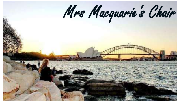
Mrs Macquarie's Chair