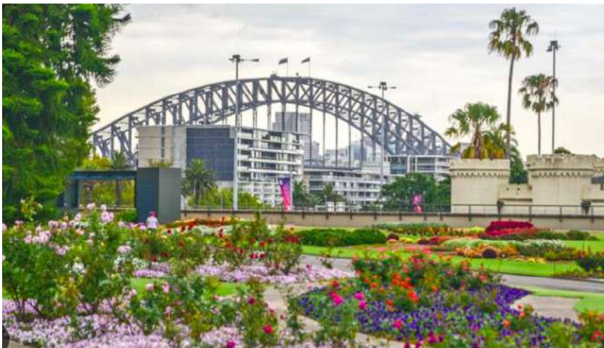
Royal Botanic Gardens