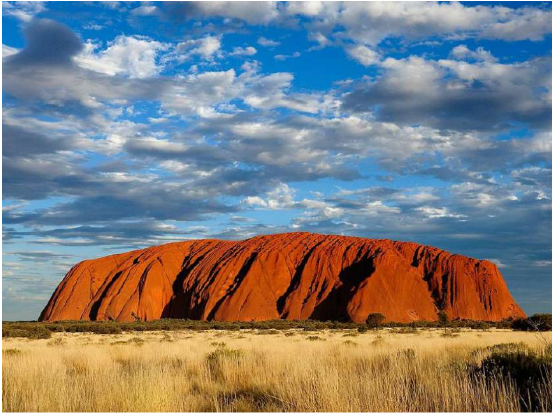
Uluru Kata Tjuta National Park