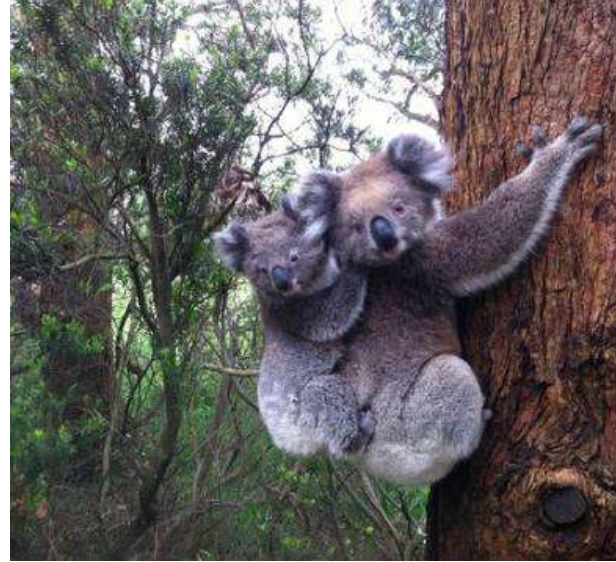
Great Otaway National Park