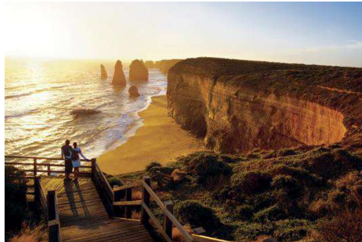
Port Campbell National Park