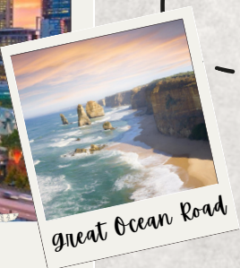
Great Ocean Road